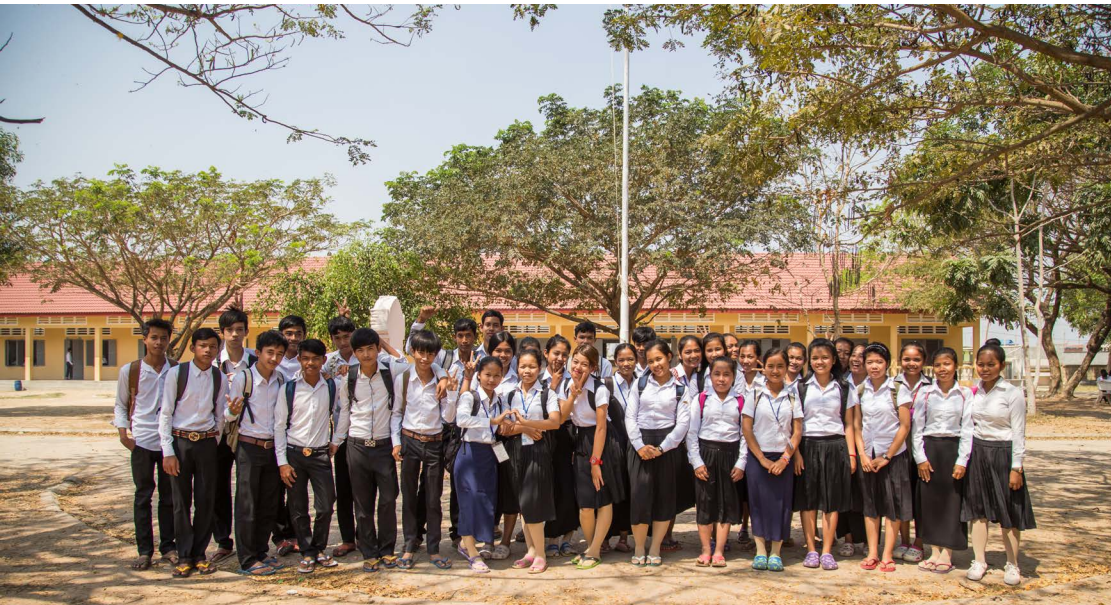
ប្រកបដោយបណ្ណសាស្ត្រនៃមជ្ឈមណ្ឌលឯកសារកម្ពុជា/ អ៊ូច មករា។ ការពិពណ៌នា៖ ផង ពង្សាសី

លទ្ធិប្រជាធិបតេយ្យមិនសុទ្ធតែតែចេញមកពីសាលាក្រុង អគារសភា និងកែងផ្លូវនោះទេ។ លទ្ធិប្រជាធិបតេយ្យក៏អាចចាប់ផ្តើមចេញពីថ្នាក់រៀនដែរ។ ការអប់រំ ជាពិសេសតាមរបបសិស្សមជ្ឈឹម ក្តោបនូវសំពះមួយរវាងតម្រូវការក្នុងការផ្លាស់ប្តូរ និងតម្រូវការក្នុងការទទួលបានស្ថិរភាព។ សំពះនេះបង្កើតឲ្យមានការពិភាក្សាដែលសង្គមក្រោយជម្លោះត្រូវតែប្រកាន់ខ្ជាប់ ប្រសិនបើសង្គមនេះចង់ដកខ្លួនចេញពីរង្វិលជុំប្រវត្តិសាស្ត្រនៃភាពចង្អៀតចង្អល់ ការតាបសង្កត់ និងអំពើហិង្សា។ ក្នុងន័យនេះ ការអប់រំជាផ្លូវមួយសម្រាប់សេរីភាពដ៏ថ្មីសន្តិសុខ។ រូបភាពនេះបង្ហាញអំពីសិស្សានុសិស្សថ្នាក់ទី២មួយក្រុមមកពីវិទ្យាល័យអុណរត្នី ជាវិទ្យាល័យមួយក្នុងចំណោមវិទ្យាល័យ១៥ នៃវិទ្យាល័យទាំងអស់នៅក្នុងរាជធានីភ្នំពេញ ដែលក្រុមការងាររបស់មជ្ឈមណ្ឌលឯកសារកម្ពុជាបានចុះទៅធ្វើវេទិកាថ្នាក់រៀនអំពីប្រវត្តិសាស្ត្រកម្ពុជាប្រជាធិបតេយ្យ។ សិស្សទាំងនេះកំពុងរង់ចាំត្រង់គ្រាប់ទទួលយកការបង្ហាត់បង្ហាញ ពីបុគ្គលិកមជ្ឈមណ្ឌលឯកសារកម្ពុជាទាក់ទងនឹងប្រវត្តិសាស្ត្រកម្ពុជាប្រជាធិបតេយ្យ និងទទួលយករៀនរាល់សិក្សាអំពីប្រវត្តិសាស្ត្រកម្ពុជាប្រជាធិបតេយ្យ។ សៀវភៅសិក្សានេះត្រូវបានប្រគល់ជូនសិស្សម្នាក់ៗ ក្នុងអំឡុងពេលវេទិកាថ្នាក់រៀនរបស់មជ្ឈមណ្ឌលឯកសារកម្ពុជា។