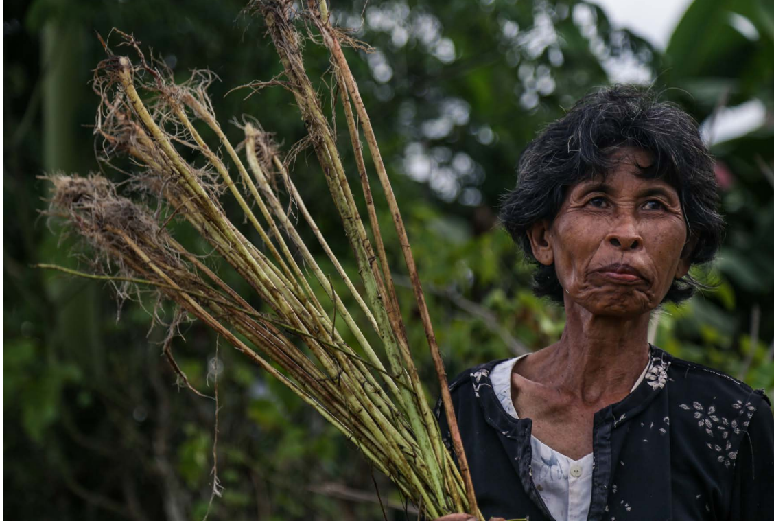
កសិករម្នាក់ដែលកំពុងប្រមូលផលនៅខេត្តកំពង់ធំ គឺជាអ្នករស់រានមានជីវិតម្នាក់ក្នុងចំណោមអ្នករស់រានមានជីវិតរាប់លាននាក់ទៀត ដែលរស់រានមានជីវិតពីអំពើហោរយោ របស់បក្សកម្ពុជាប្រជាធិបតេយ្យ។ ស្ថិតនៅក្រោមរបបនេះ ប្រជាជនប្រមាណពីរលាននាក់បានបាត់បង់ជីវិតដោយសារតែការបង្កកំហុស ការធ្វើការងារហួសកម្លាំង ទារុណកម្ម និងការសម្លាប់។ អ្នករស់រានមានជីវិតពីអំពើហោរយោនេះ នៅតែបន្តរងទុក្ខពីឥទ្ធិពលអូសបន្លាយនៃការប៉ះទង្គិចផ្លូវអាមេរិក ដែលបង្កទៅជាជំងឺរ៉ាំរ៉ៃទាំងផ្នែកផ្លូវកាយ និងផ្លូវចិត្ត។

ការអប់រំអំពីប្រល័យពូជសាសន៍មានសារៈសំខាន់ណាស់ ក្នុងការចងចាំរបស់ប្រជាជនកម្ពុជាដែល បានបាត់បង់ជីវិតក្នុងអំពើព្រៃផ្សៃរបស់ខ្មែរក្រហម ជាពិសេសក្នុងជម្រកចិត្ត និងសម្បជញ្ញៈរបស់មនុស្សជំនាន់ ក្រោយដែលជាប្រជាជនរយៈក្នុង។ ការអប់រំប្រភេទនេះចាំបាច់ណាស់ប្រសិនបើប្រជាជនកម្ពុជាមានបំណងចង់ ដឹងអំពីមូលហេតុ និងរបៀបដែលអំពើប្រល័យពូជសាសន៍បានកើតឡើង យល់ដឹងអំពីផលប៉ះពាល់នៃសោក នាជកម្មនេះ និងដោះស្រាយឧបសគ្គបន្តបន្ទាប់ជាច្រើនដែលកើតមានដោយសារអំពើប្រល័យពូជសាសន៍។