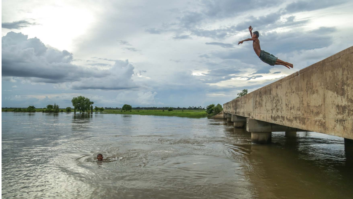
ថ្មីក្តីបានឆ្លងកាត់សង្គ្រាម អំពីប្រល័យពូជសាសន៍ និងទុក្ខវេទនាអស់ជាច្រើនទសវត្សរ៍ កម្ពុជានៅតែមិនបាត់បង់ស្មារតីក្នុងការរស់នៅ ព្រមទាំងមានភាពម៉ោងមុតចំពោះ អនាគតដ៏ប្រសើរ។ ការតស៊ូនេះនៅមិនទាន់ចប់នៅឡើយទេ។ នេះគ្រាន់តែជាការចាប់ផ្តើមតែប៉ុណ្ណោះ។ អនាគតរបស់កម្ពុជានឹងមិនត្រឹមតែពឹងផ្អែកលើការគ្រិះរិះពិចារណា អំពីអតីតកាលរបស់ខ្លួន ក៏ដូចជាបញ្ហានានាពេលបច្ចុប្បន្នតែប៉ុណ្ណោះទេ ប៉ុន្តែក៏ត្រូវពឹងផ្អែកលើភាពម៉ោងមុតរបស់យើងក្នុងការប្រឈមនឹងកាលដែលមាននៅខាងមុខ ថែមទៀត។ ការពិពណ៌នា៖ សូ ហ្វារីណា

ក្នុងអំឡុងពេលប្រមាណសែសិបខែ ប្រជាជនកម្ពុជាជាងពីរលាននាក់បានបាត់បង់ជីវិតដោយសារតែ ការធ្វើ ការងារហួសកម្លាំង ការបង្កត់អាហារទ្រង់ទ្រាយធំ ការធ្វើទារុណកម្ម និងការសម្លាប់រង្គាលក្នុងចំណោមឧក្រិដ្ឋ កម្មដទៃទៀតដែលធ្វើឡើងដោយរបបខ្មែរក្រហម។ ដោយប្រកាន់ខ្ជាប់នូវគោលការណ៍ស្មើភាពជ្រុលនិយមរបស់ លទ្ធិកុម្មុយនីស្ត របបនេះបានប្រែក្លាយប្រទេសទាំងមូលទៅជាការដ្ឋានពលកម្មធ្ងន់ធ្ងរបំផុត។ ចំពោះអ្នកដែល មិនបានស្លាប់ដោយសារការសម្លាប់ ត្រូវបានចាត់បង់ជីវិតដោយសារតែផលប៉ះពាល់ដែលអូសបន្លាយ ក្នុងនោះ រួមមានភាពអត់ឃ្លាន ជំងឺ និងការខ្សោះកម្លាំង។ ជំងឺផ្លូវចិត្តដ៏តឹងតែងនៅតែបន្តដក់ជាប់នៅក្នុងចិត្តនៃជំនាន់ មនុស្សដែលរស់នៅក្នុងសម័យកាលនៃឧក្រិដ្ឋកម្មឃោរឃៅទ្រង់ទ្រាយធំនេះ។ អ្នករស់រានមានជីវិតជាច្រើននៅតែ