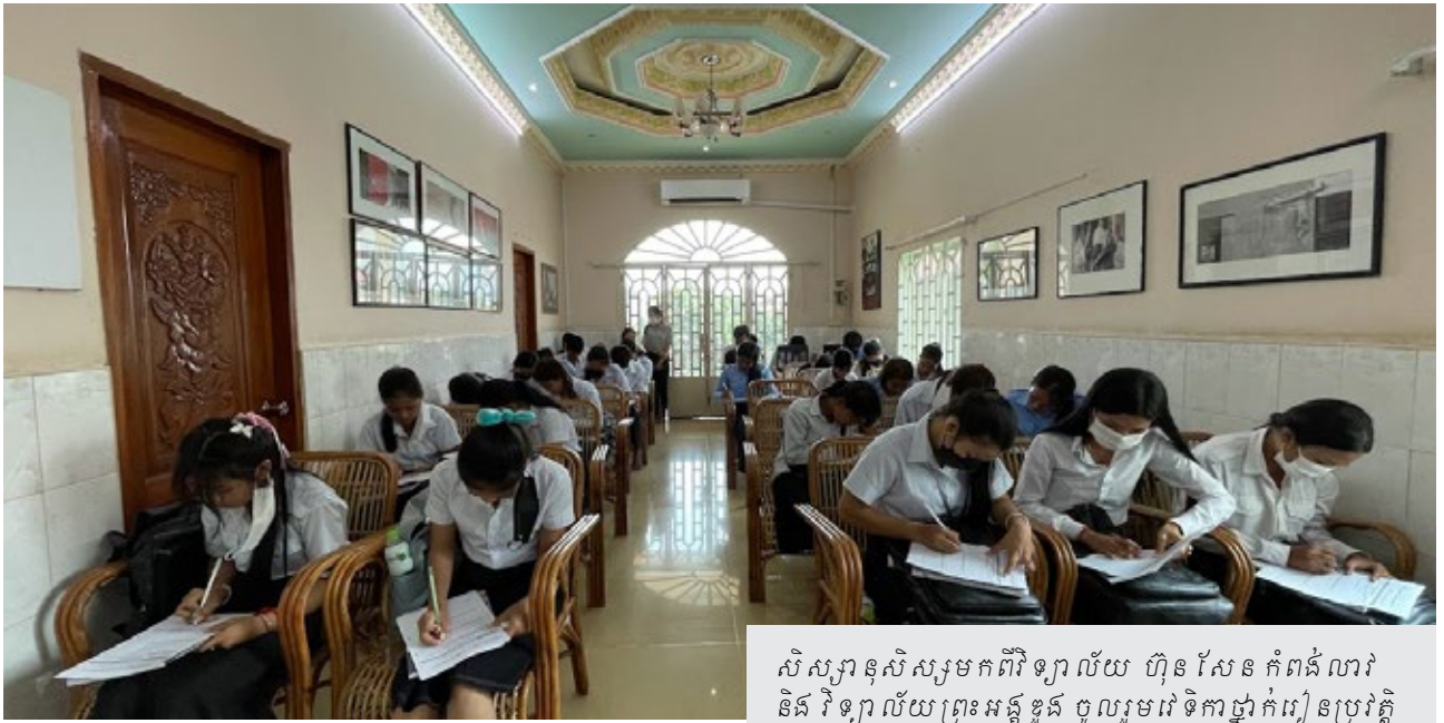
សិស្សានុសិស្សមកពីវិទ្យាល័យ ហ៊ិនសែន កំពង់ឆ្នាំង និង វិទ្យាល័យព្រះអង្គឌួង ចូលរួមវេទិកាថ្នាក់រៀនប្រវត្តិសាស្ត្រកម្ពុជាប្រជាធិបតេយ្យនៅមជ្ឈមណ្ឌលឯកសារខេត្តព្រៃវែង។

ម្នាក់កត់ ឬស្មើនឹង ៣% នៃចំនួនសិស្សទាំងអស់ឆ្លើយថា ខ្លួនបានដឹងប្រវត្តិសាស្ត្រខ្មែរក្រហម តាមរយៈការអានសៀវភៅ និងតាមដានប្រព័ន្ធផ្សព្វផ្សាយហ្វេសប៊ុក ទស្សនាវីដេអូ កាសែត ទូរទស្សន៍ វិទ្យុ គេហទំព័រ និងយូធូប។ ចំពោះការយល់ដឹងអំពីនិយមន័យនៃអំពើប្រល័យពូជសាសន៍ យើងសង្កេតឃើញថា សិស្សានុសិស្សបានបង្ហាញពីចម្លើយខុសៗគ្នាតាមការយល់ឃើញរបស់ខ្លួន។ ក្នុងនោះ សិស្សប្រើនូវ ៦០% ឆ្លើយថា អំពើប្រល័យពូជសាសន៍គឺជា «អំពើទាំងឡាយណាដែលប្រព្រឹត្តឡើងក្នុងកោលបំណងបំផ្លិចបំផ្លាញចោលទាំងស្រុង ឬដោយផ្នែកចំពោះក្រុមជនជាតិ ជាតិពន្ធុ ពូជសាសន៍ ឬក្រុមសាសនា»។ សិស្សានុសិស្សទាំងអស់ត្រូវវាស់ស្ទង់ចំណេះដឹងមុន និង ក្រោយពេលធ្វើវេទិកាថ្នាក់រៀនថា តើអ្នកទាំងនោះយល់ដឹងអ្វីខ្លះពីវិធីសាស្ត្រទប់ស្កាត់អំពើប្រល័យពូជសាសន៍។