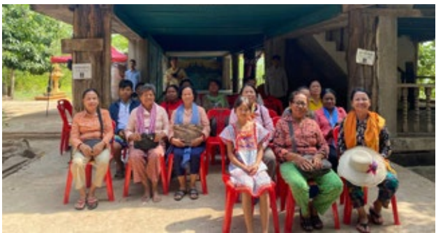
ប្រជាជននៅក្នុងស្រុកអន្លង់វែងជួបជុំគ្នា ដើម្បីទស្សនាការដ្ឋានបង្កើនជំនាញពិរនៃព្រឹត្តិការណ៍ប្រកួតកីឡាអាស៊ីអាគ្នេយ៍លើកទី៣២ និងកីឡាអាស៊ីនាំវារហ្វេមលើកទី១២ នៅក្នុងសារមន្ទីរអតីតដុះតាម៉ុក ចាប់ពីថ្ងៃទី២៩ ខែមេសា រហូតដល់ថ្ងៃទី១២ ខែឧសភា ឆ្នាំ២០២៣ រៀបចំឡើងដោយរដ្ឋបាលស្រុកអន្លង់វែង សហការជាមួយមជ្ឈមណ្ឌលសន្តិភាពអន្លង់វែង។