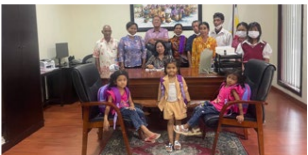
អ្នករស់រាន មា នជីវិតពីរបបខ្មែរក្រហម រួមជាមួយកូន និង ថៅចំនួន១៥នាក់ មកពិគ្រោះដល់ប្រយោជន៍នៃភូមិបាក់នីម មកធ្វើទស្សនកិច្ចព្រះបរមរាជវាំង, បណ្ណាល័យសម្តេចម៉ែ នៃមជ្ឈមណ្ឌលឯកសារកម្ពុជាក្នុងក្រុងភ្នំពេញ, ស្ថានទូត ហ្វីលីពីន ព្រមទាំងទីតាំងវប្បធម៌ និងប្រវត្តិសាស្ត្រ មួយចំនួនទៀតក្នុងទីក្រុងភ្នំពេញរយៈពេលពីរថ្ងៃ គឺចាប់ពី ថ្ងៃទី០៨ ដល់០៩ ខែឧសភា ឆ្នាំ២០២៣។