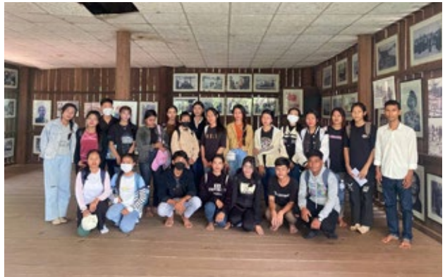
សិស្សានុសិស្សមកពីវិទ្យាល័យគេដោសៃន សំរោងចូលរួមវេទិកាថ្នាក់រៀនចុងសប្តាហ៍ស្តីពីប្រវត្តិ សាស្ត្រកម្ពុជាប្រជាធិបតេយ្យ( ១៩៧៥-១៩៧៩) នៅមជ្ឈមណ្ឌលសន្តិភាពអន្តរវិស័យ កាលពីថ្ងៃទី១៣ ខែឧសភា ឆ្នាំ២០២៣។