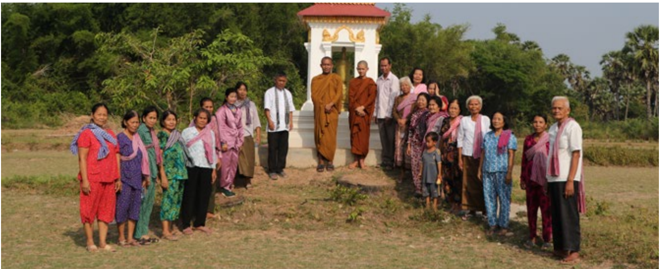
ប្រជាជនចូលរួមរៀបចំពិធីបង្ហាញលទ្ធផលសិក្សាស្រាវជ្រាវគ្រោះដែលបានស្លាប់ក្នុងរបបខ្មែរក្រហមនៅឃុំកករ ស្រុកកំពង់សៀម ខេត្តកំពង់ចាម