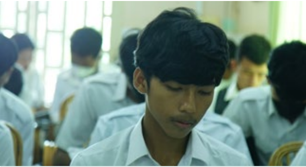
សិស្សានុសិស្សចូលរួមវេទិកាថ្នាក់រៀនចុងសប្តាហ៍ ស្តីពីប្រវត្តិសាស្ត្រកម្ពុជា ប្រជាធិបតេយ្យនៅមជ្ឈមណ្ឌល ឯកសារខេត្តព្រៃវែង។

ស្រដៀងគ្នាថា ការបង្កើតសហករណ៍ គឺពិតជា នាំឲ្យ ប្រជាជនស្លាប់ច្រើន ព្រោះប្រជាជនត្រូវធ្វើការ ហួស កម្លាំង, គ្រោះអត់ឃ្នា ន, បាត់បង់ស្មារតី និងវិញ្ញាណ, បែកបាក់ក្រុមគ្រួសារ, ទារុណកម្ម និងការជម្លៀស។ ចម្លើយរបស់សិស្សានុសិស្សចំនួន៤៩ នាក់ដំបូង ត្រូវ បានយកមកក្លាប់ជាមួយនឹងសំណេរ ដូចខាងក្រោម៖