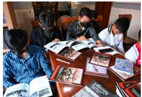
សិស្សានុសិស្សមកពីវិទ្យាល័យគេដៅសែន សំរោងចូលរួមវេទិកាថ្នាក់រៀនចូលសប្តាហ៍ស្តីអំពី «ប្រវត្តិសាស្ត្រកម្ពុជាប្រជាធិបតេយ្យ (១៩៧៥-១៩៧៩)» នៅមជ្ឈមណ្ឌលសន្តិភាពអន្តរវិស័យកាលពីថ្ងៃទី១៣ ខែឧសភា ឆ្នាំ២០២៣។

សិស្សានុសិស្សវិទ្យាល័យគេដៅសែនសំរោង ចំនួន៣៤នាក់ ក្នុងនោះមានស្រីចំនួន២៦នាក់ និងប្រុសចំនួន៨នាក់ បានមកចូលរួមវេទិកាថ្នាក់រៀនចូលសប្តាហ៍ស្តីអំពីប្រវត្តិសាស្ត្រកម្ពុជាប្រជាធិបតេយ្យ (១៩៧៥-១៩៧៩) នៅមជ្ឈមណ្ឌលសន្តិភាពអន្តរវិស័យ កាលពីថ្ងៃទី១៣ ខែឧសភា ឆ្នាំ២០២៣ វេទិកាថ្នាក់រៀននេះ ត្រូវបានរៀបចំឡើងក្នុងគោលបំណងផ្តល់ការយល់ដឹងដល់យុវជនអំពីប្រវត្តិសាស្ត្រកម្ពុជាប្រជាធិបតេយ្យដែលជាផ្នែកមួយដ៏សំខាន់ដើម្បីការចងចាំ ការថែរក្សាសន្តិភាពនិងការដោះដូរការធ្វើបទប្បញ្ញត្តិ និងការពិភាក្សាបានផ្តោតសំខាន់