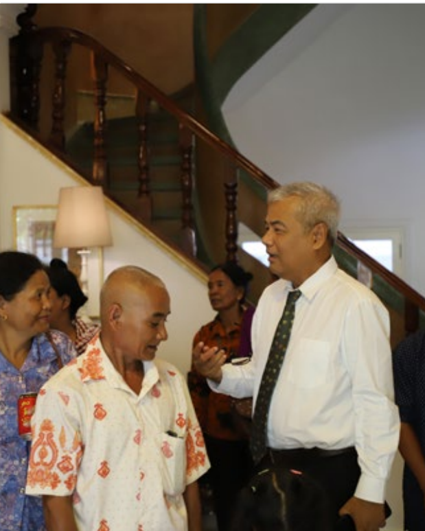
នៅថ្ងៃនេះ អ្នករស់រានមា នេដ្ឋវិភពីរបបខ្មែរក្រហម ពី តំបន់ដាច់ស្រយាលនៃភូមិបាក់នីម អញ្ជើញទៅ ទស្សនកិច្ចព្រះបរមរាជវាំង។ បន្ទាប់មក អ្នករស់រាន មា នេដ្ឋវិភពីរបបខ្មែរក្រហមមកពីតំបន់ដាច់ស្រយាល នៃភូមិបាក់នីម ទាំងនេះ បន្តដំណើរ មកទស្សនកិច្ច បណ្ណាល័យសម្តេចម៉ែនៃមជ្ឈមណ្ឌលឯកសារកម្ពុជា ដែលមានចម្ងាយប្រមាណ ១,០០០ម៉ែត្រ ពីព្រះបរម រាជវាំង។

គឺចាប់ពីថ្ងៃទី០៨ ដល់០៩ ខែឧសភា ឆ្នាំ២០២៣ ដំណើរទស្សនកិច្ចនេះ រៀបចំឡើងដោយ ក្រុមការងារ គម្រោង «ការលើកកម្ពស់សិទ្ធិ និងការធ្វើឲ្យប្រសើរ ឡើងនូវស្ថានភាពសុខភាពរបស់អ្នករស់រានមា នេដ្ឋវិភ ពីរបបខ្មែរក្រហម» នៃមជ្ឈមណ្ឌលឯកសារកម្ពុជា ភ្នំក្រវាញ លំបំណងដើម្បីឲ្យអ្នករស់រានមា នេដ្ឋវិភពីរបប ខ្មែរក្រហមរស់នៅតំបន់ដាច់ស្រយាលបានសិក្សា ឈ្លើយលំបំណងដើម្បីប្រវត្តិសាស្ត្រសង្គម វប្បធម៌ ខាងក្រៅឲ្យកាន់តែទូលំទូលាយ។