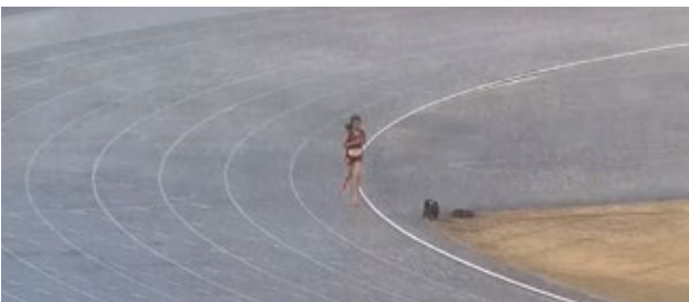
កញ្ញា ប៊ូ សំណាង គឺជាអគ្គពលិកក្នុងវិញ្ញាសារតំបន់មួយ ៥០០០ម៉ែត្រ កីឡាអាស៊ីអាគ្នេយ៍លើកទី៣២ ដែលកម្ពុជាធ្វើជាម្ចាស់ផ្ទះ កាលពីថ្ងៃទី ៨ ខែឧសភា ឆ្នាំ២០២៣។