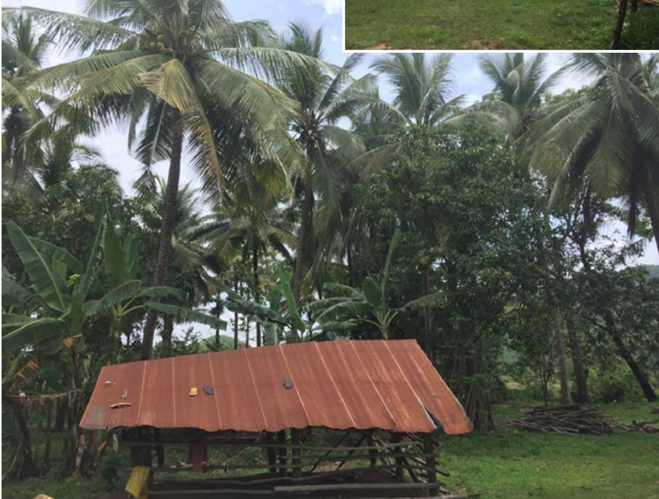
ទេសភាព និងដំណាំនៅផ្ទះ ឃុំត្បូង ថ្ងៃទី២ ខែឧសភា ឆ្នាំ២០២២