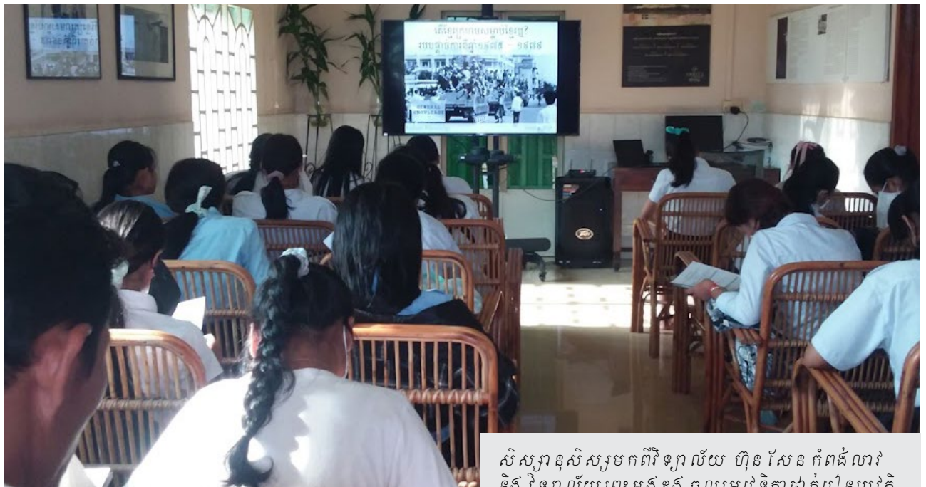
សិស្សានុសិស្សមកពីវិទ្យាល័យ ហ៊ុន សែន កំពង់លាវ និង វិទ្យាល័យព្រះអង្គឌួង ចូលរួមវេទិកាថ្នាក់រៀនប្រវត្តិសាស្ត្រកម្ពុជាប្រជាធិបតេយ្យនៅមជ្ឈមណ្ឌលឯកសារខេត្តព្រៃវែង ( បណ្ណសារមជ្ឈមណ្ឌលឯកសារកម្ពុជា )

យុវជនអាយុក្រោម១៩ឆ្នាំ មានឪពុកម្តាយមិនធ្លាប់ឆ្លងកាត់របបខ្មែរក្រហម ចំនួន៣២នាក់ ក្នុងនោះស្រី២៥នាក់ បានចូលរួមកម្មវិធីវេទិកាថ្នាក់រៀនចុងសប្តាហ៍ រៀបចំដោយមជ្ឈមណ្ឌលឯកសារខេត្តព្រៃវែង នៅថ្ងៃទី៧ ខែឧសភា ឆ្នាំ២០២៣។ យុវជនទាំងនោះ គឺជាសិស្សានុសិស្សមកពីវិទ្យាល័យ ហ៊ុន សែន កំពង់លាវ និងវិទ្យាល័យព្រះអង្គឌួង ក្នុងខេត្តព្រៃវែង។ តាមរយៈការបំពេញតារាងស្ទាបស្ទង់មតិមុនពេលធ្វើវេទិកាថ្នាក់រៀនឃើញថា ក្នុងចំណោមសិស្សានុសិស្សទាំងអស់សុទ្ធតែធ្លាប់បានដឹងពីប្រវត្តិ-