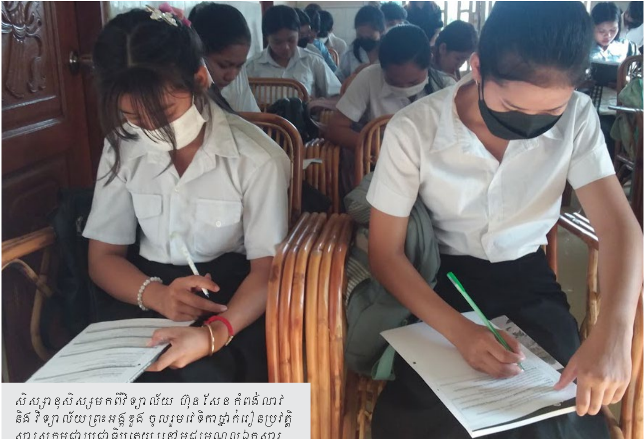
សិស្សានុសិស្សមកពីវិទ្យាល័យ ហ៊ុន សែន កំពង់ លាវ និងវិទ្យាល័យព្រះអង្គឌួង ចូលរួមវេទិកាថ្នាក់រៀនប្រវត្តិ សាស្ត្រកម្ពុជាប្រជាធិបតេយ្យនៅមជ្ឈមណ្ឌលឯកសារ ខេត្តព្រៃវែង។

កើតមិនទាន់។ ចំពោះមេរៀនប្រវត្តិសាស្ត្រកម្ពុជា ប្រជាធិបតេយ្យដែលខ្ញុំចង់ចាំជាងគេ គឺក្រោយរបប ខ្មែរក្រហមដួលរលំ បានបន្សល់ទុកនូវស្រ្តីមេម៉ាយ ក្មេងកំព្រា ជនពិការ និងគ្រាប់មីនរាយពេញផ្ទៃ ប្រទេស។ ខ្ញុំជឿថារបបនេះពិតជាកើតមានមែន នៅក្នុងប្រទេសកម្ពុជា ព្រោះមានភស្តុតាងដែលបាន សរសេរនៅក្នុងសៀវភៅ និងសំអាងទៅលើការស្តាប់ បទពិសោធន៍ពិតរបស់លោកគាណាណាមួយ និង ឪពុកម្តាយរបស់ខ្ញុំ។ ជាចុងក្រោយ ខ្ញុំនឹងខិតខំប្រឹង ប្រែងរៀនសូត្រឲ្យមានចំណេះដឹងខ្ពង់ខ្ពស់ បញ្ឈប់ ការរើសអើងជាតិសាសន៍ និងសូមសំណូមពរឲ្យ ប្រជាជនជួយរក្សាប្រទេសជាតិឲ្យមានសុខសន្តិភាព និងព្យាយាមទប់ស្កាត់មិនឲ្យរបបខ្មែរក្រហមវិល ត្រឡប់មកវិញសារជាថ្មីម្តងទៀត។