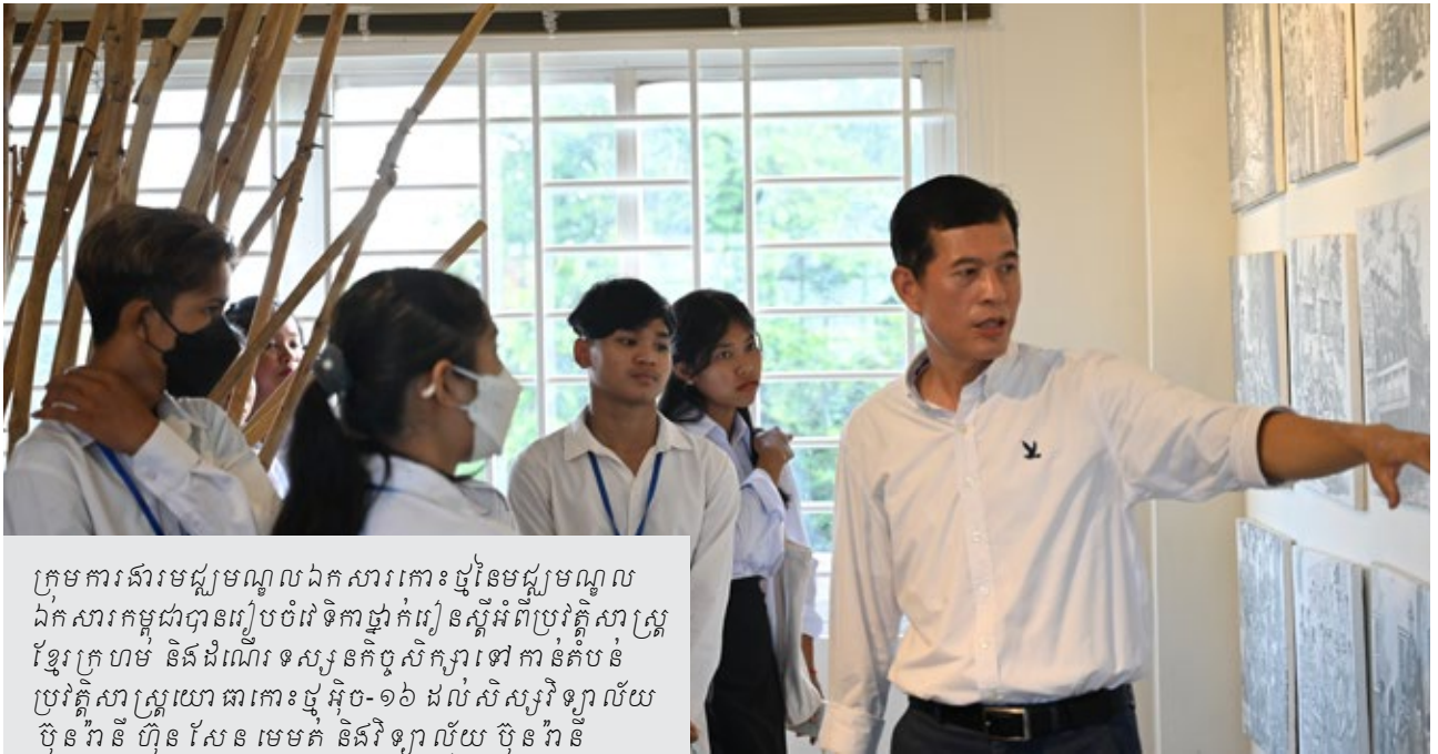
ក្រុមការងារមជ្ឈមណ្ឌលឯកសារកោះ ថ្មីនៃមជ្ឈមណ្ឌលឯកសារកម្ពុជាបានរៀបចំវេទិកាថ្នាក់រៀនស្តីអំពីប្រវត្តិសាស្ត្រខ្មែរក្រហម និងដំណើរទស្សនកិច្ចសិក្សាទៅកាន់តំបន់ប្រវត្តិសាស្ត្រយោធាកោះ ថ្មី អ៊ុច-១៦ ដល់សិស្សវិទ្យាល័យ ហ៊ុន សែន ហ៊ុន សែន មេមត់ និងវិទ្យាល័យ ហ៊ុន សែន ហ៊ុន សែន ដារ ចំនួន៥០នាក់ នៅព្រឹកថ្ងៃទី១៦ ខែឧសភា ឆ្នាំ២០២៣។

ខុសគ្នា ដល់ចុងខែឆ្នាំ១៩៧៨ កងកម្លាំងប្រដាប់អាវុធសាមគ្គីសង្គ្រោះ ជាតិកម្ពុជាបានរីកធំធាត់ និងកើនចំនួនរហូតដល់២៣កងវរសេនាភូមិ និងប្រមាណ១០០ក្រុមប្រតិបត្តិការប្រដាប់អាវុធដែលមានកងកម្លាំងសរុបប្រមាណជាង១ម៉ឺននាក់។ បន្ទាប់មកកងកម្លាំងប្រដាប់អាវុធសាមគ្គីសង្គ្រោះជាតិកម្ពុជាបានសហការជាមួយកងទ័ពស្ម័គ្រចិត្តរៀតណាមវាយផ្តួលរំលំរបបប្រល័យពូជសាសន៍ ប៉ុល ពត រំដោះប្រជាជនកម្ពុជាប្រមាណ៥លាននាក់ឲ្យរួចផុតពីរបបប្រល័យពូជសាសន៍ ប៉ុល ពត នៅថ្ងៃទី៧ ខែមករា ឆ្នាំ១៩៧៩។