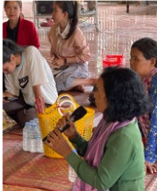
មជ្ឈមណ្ឌលឯកសារខេត្តព្រៃវែង បានរៀបចំធ្វើទិកា អប់រំសហគមន៍ ដើម្បីពិភាក្សាអន្តរជំនាន់រវាងអ្នករស់រាន មានជីវិតពីរបបខ្មែរក្រហមដែលមានអាយុចាប់ពី៥០ឆ្នាំ ឆ្ពើងទៅ ជាមួយសិស្សានុសិស្សដែលជាកូនជំនាន់ ក្រោយមកពីអនុវិទ្យាល័យ និងវិទ្យាល័យផ្សេងគ្នា ក្នុង ឃុំអង្គរស ស្រុកមេសាង ខេត្តព្រៃវែង កាលព្រឹកថ្ងៃទី១២ ខែឧសភា ឆ្នាំ២០២៣។