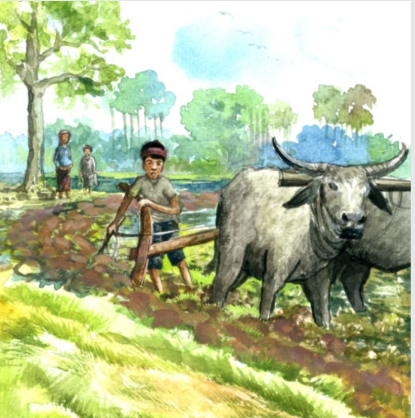
ទិដ្ឋភាព៖ ពេលព្រឹកបងស្រី និងប្អូនវាយកបបរមកឲ្យខ្ញុំនៅឯស្រែដម្រៅមាត់បឹង ដែលខ្ញុំកំពុងក្លែង។