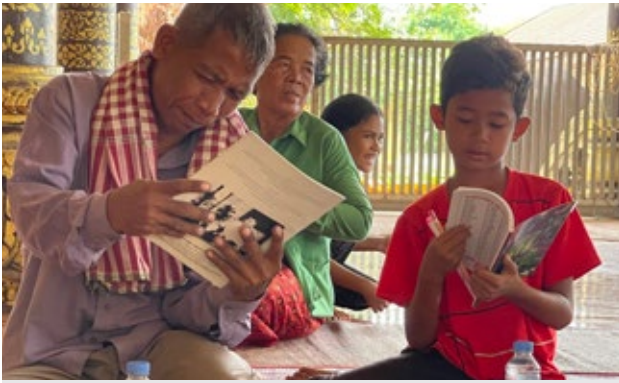
មជ្ឈមណ្ឌលឯកសារខេត្តព្រៃវែង បានរៀបចំធ្វើវេទិកាអប់រំសហគមន៍ ដើម្បីពិភាក្សាអន្តរជំនាន់រវាងអ្នករស់រានមានជីវិតរបបខ្មែរក្រហមដែលមានអាយុចាប់ពី៥០ឆ្នាំឡើងទៅ ជាមួយសិស្សានុសិស្សដែលជាកូនជំនាន់ក្រោយមកពីអនុវិទ្យាល័យ និងវិទ្យាល័យផ្សេងគ្នាក្នុងឃុំអង្គរសស្រុកមេសាង ខេត្តព្រៃវែង កាលព្រឹកថ្ងៃទី១២ ខែឧសភា ឆ្នាំ២០២៣។

«ការបង្កើតសហគមន៍ខ្មែរក្រហម និងឈ្មួញលំដាប់ទុក្ខលំបាក ការសម្លាប់ និងជីវិតរស់នៅប្រចាំថ្ងៃរបស់ប្រជាជនក្នុងសម័យនោះ ដែលជាជនលិខិតលំបាកបន្ទាប់ពីការបង្កើតសហគមន៍»។ វេទិកានេះត្រូវបានរៀបចំឡើង នាព្រឹកថ្ងៃទី១២ ខែឧសភា ឆ្នាំ២០២៣ ក្នុងបរិវេណវត្តពន្លៃភូមិពន្លៃឃុំអង្គរសស្រុកមេសាង ខេត្តព្រៃវែង ដោយមានអ្នករស់រានមានជីវិតរបបខ្មែរក្រហមចំនួន១០នាក់ និងសិស្សដែលជាយុវជនជំនាន់ក្រោយចំនួន២០នាក់ មកចូលរួម។