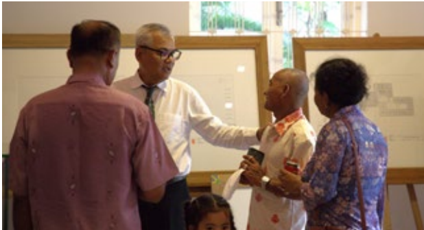
អ្នករស់រានមា នេដ្ឋវិភពីរបបខ្មែរក្រហម រួមជាមួយកូន និង ប្រើប្រាស់នៃ១៥ នាក់ មកពីតំបន់ដាច់ស្រយាលនៃភូមិបាក់នីម មកធ្វើទស្សនកិច្ចព្រះបរមរាជវាំង, បណ្ណាល័យសម្តេចម៉ែ នៃមជ្ឈមណ្ឌលឯកសារកម្ពុជាភ្នំក្រវាញ, ស្ថានទូត ហ្វីលីពីន ព្រមទាំងទីតាំងវប្បធម៌ និងប្រវត្តិសាស្ត្រ មួយចំនួនទៀតភ្នំក្រវាញរយៈពេលពីរថ្ងៃ ពីថ្ងៃទី០៨ ដល់០៩ ខែឧសភា ឆ្នាំ២០២៣