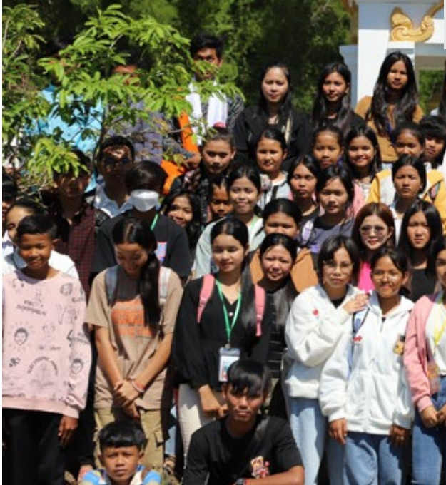
នៅថ្ងៃទី១៥ ខែឧសភា ឆ្នាំ២០២៣ មជ្ឈមណ្ឌលឯកសារខេត្ត កំពង់ចាម រៀបចំវេទិកាថ្នាក់រៀនស្តីពីប្រវត្តិសាស្ត្រកម្ពុជា ប្រជាធិបតេយ្យ (១៩៧៥-១៩៧៩) ផ្ដោតទៅលើប្រធាន បទ «ការចងចាំជំនឿគ្រោះស្លាប់ក្នុងរបបខ្មែរក្រហម» ដោយ មានការចូលរួមពីសិស្សានុសិស្សចំនួន ៦៦ នាក់មកពីវិទ្យាល័យ សម្រេច ហ៊ុន សែន សង្កែប ស្ថិតនៅស្រុកបាធាយ