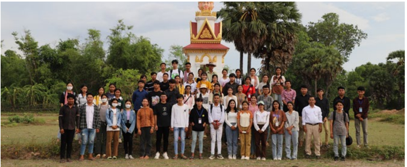
នៅថ្ងៃទី១៤ ខែឧសភា ឆ្នាំ២០២៣ មជ្ឈមណ្ឌលឯកសារខេត្តកំពង់ចាម បានរៀបចំវេទិកាផ្លាស់ប្តូរទិសដៅសិក្សាស្រាវជ្រាវ កម្ពុជា ប្រជាធិបតេយ្យ (១៧៧៥-១៧៧៧) ផ្ដោតលើប្រធានបទ ៖ «ការចងចាំជនរងគ្រោះស្លាប់ក្នុងរបបខ្មែរក្រហម និងបទពិសោធន៍មិនអាចបំភ្លេចបានរបស់អ្នករស់រានមានជីវិតពីរបបខ្មែរក្រហម» ដោយមានការចូលរួមពីសិស្សានុសិស្ស ចំនួន៥៥ នាក់មកពីវិទ្យាល័យ ប៊ុនរ៉ានី ហ៊ុនសែន ស្តី ក្នុងស្រុកចំការលើ។