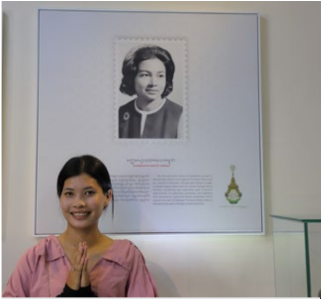
នៅថ្ងៃទី១៤ ខែឧសភា ឆ្នាំ២០២៣ មជ្ឈមណ្ឌលឯកសារខេត្តកំពង់ចាម បានរៀបចំវេទិកាថ្នាក់រៀនចុងសប្តាហ៍ស្តីអំពីប្រវត្តិសាស្ត្រកម្ពុជាប្រជាធិបតេយ្យ ( ១៩៧៥-១៩៧៩ ) ផ្ដោតលើប្រធានបទ « ការចងចាំជំនឿនៃគ្រោះស្លាប់ក្នុងរបបខ្មែរក្រហម និងបទពិសោធន៍អោយបង្កើតបានរបស់អ្នករស់រានមានជីវិតពីរបបខ្មែរក្រហម » ដោយមានការចូលរួមពីសិស្សានុសិស្សចំនួន៥៥នាក់មកពីវិទ្យាល័យ ប៊ុនរ៉ានី ហ៊ុនសែន ស្តីក្នុងស្រុកចំការលើ។ ( លើវេទិកាមជ្ឈមណ្ឌលឯកសារកម្ពុជា )